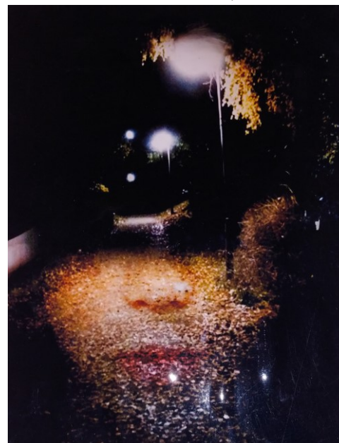
Foto av Ella Dahl, ett av få inköp som gjorts till medlemslotteriet under 2020.

De inköp som gjorts har varit alltför få för att kunna genomföra den sedvanliga utlottningen nu under våren vilket gör att vi kommer att skjuta på denna. Vi hoppas kunna återkomma med ytterligare info framåt höstkanten.